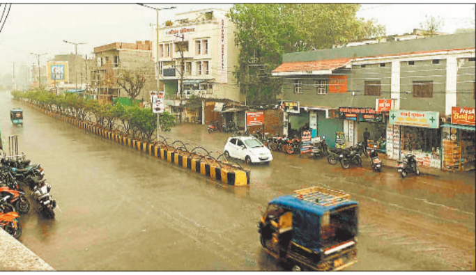
बारिश के दौरान सूनी सड़क।