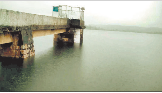
लबालब बांकी जलाशय।